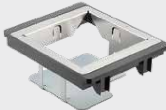
▪ 11-0178 Kit de montage avec kit Magellan HS1250